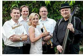
Memories of Jazz sorgen für jazzigen Sound bei der Adventsandacht